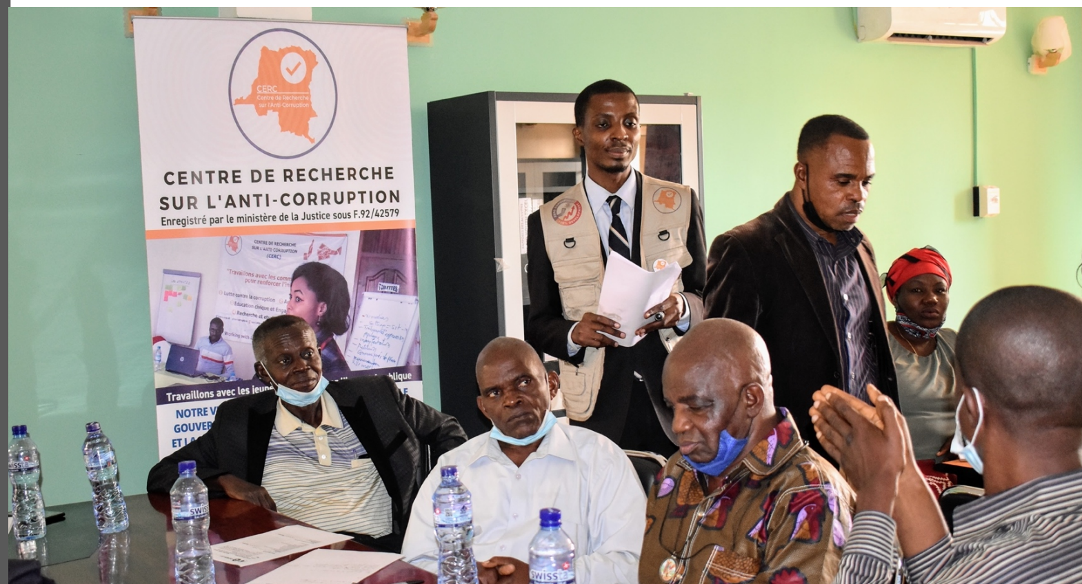
Figure1 : Les hauts responsables de l'éducation lors d'un atelier consultatif à Kinshasa, le 27 juillet 2021.