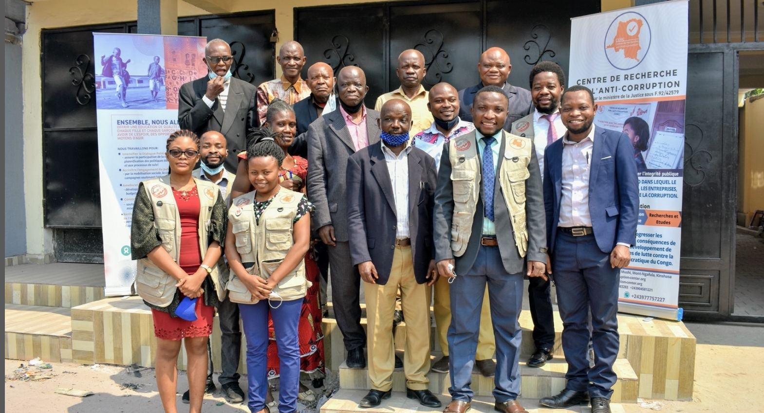
Figure2 : Les membres de CERC avec les officiels du ministère de l'éducation lors de l'atelier consultatif sur la transparence du secteur de l'éducation. Kinshasa, Juillet 2021.